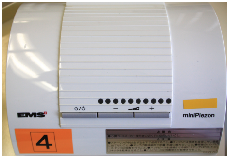
EMS社製 mini Piezon