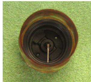
mini Piezon 用 PSチップ