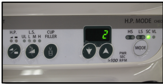
モリタ社製 ソルフィー