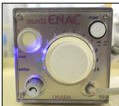
OSADA社製 ENAC (エナック)