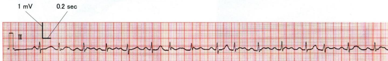
動悸が生じているとき