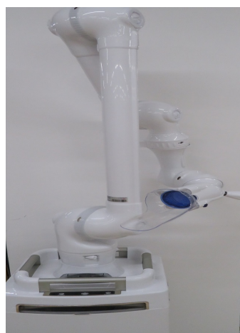
口腔外バキューム