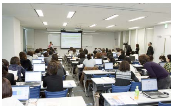
北海道医療大学 札幌サテライトキャンパス / ACU(札幌)

札幌会場と北見会場をインターネットで結び、札幌会場で実施される講義をリアルタイムに北見会場で放映します。さらに会場まで足を運ばない受講生向けに講義内容のDVDを使った自宅学習も可能にしました。もちろんこの場合も修了証が得られます。