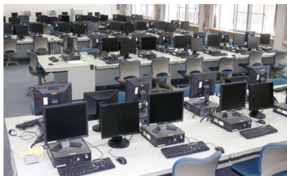
日本赤十字北海道看護大学(北見)