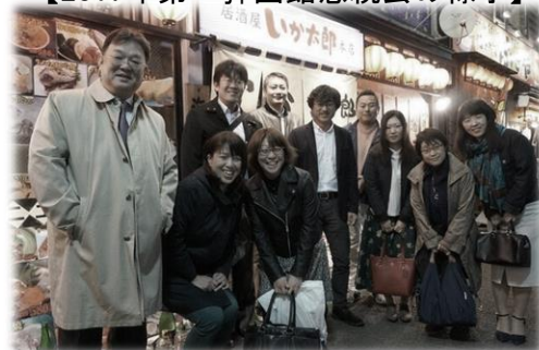
【2017年第一弾函館懇親会の様子】