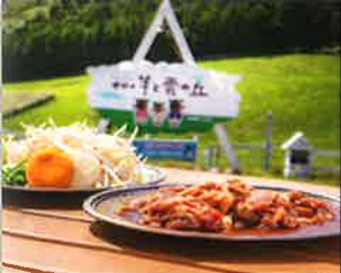
Sheep and Cloud Hill