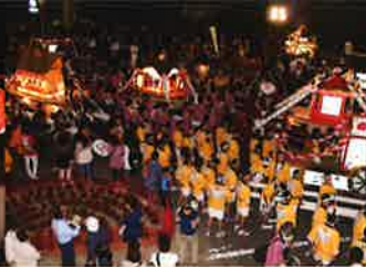
盛り上がるお祭り