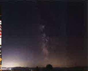
A hill full of stars